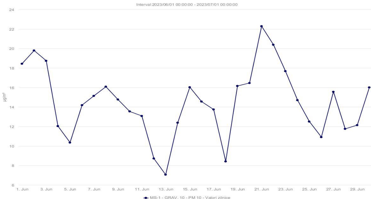
Evoluția valorilor medii zilnice ale indicatorului particule în suspensie, PM 10 gravimetric, la stația MS-1 din județul Mureș

Poluanți pentru care Legea 104/2011 stabilește valori limită pentru protecția sănătății umane a valorilor maxime zilnice a mediilor pe 8 ore :