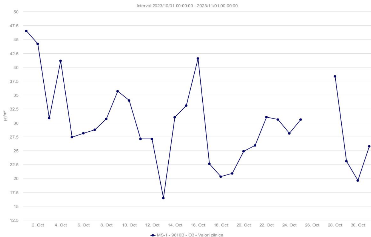
Evoluția valorilor medii zilnice ale indicatorului ozon (O 3 ), la stația MS-1 din județul Mureș